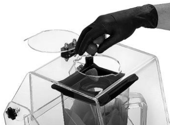
Apertura superiore con tappo