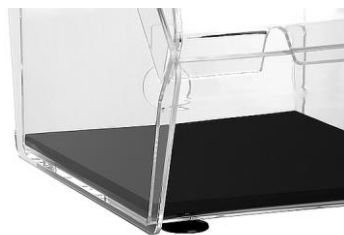
Con tappetino insonorizzante