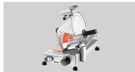
► Ausgelegt für Wurst